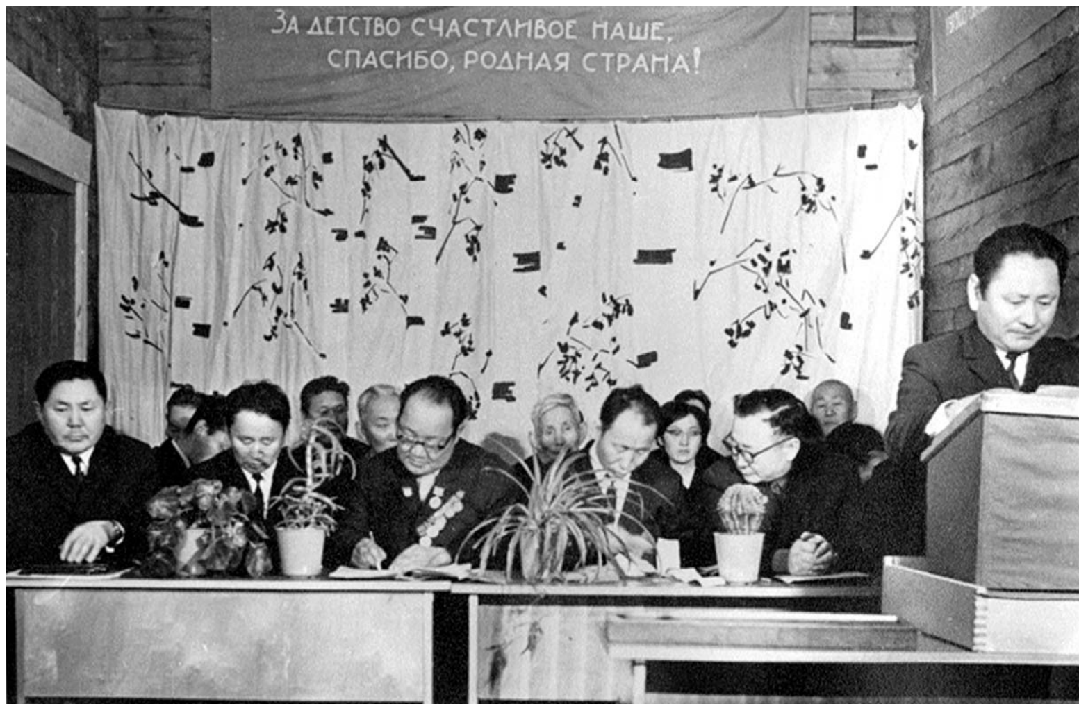
Сага оркуолаба кирии бырааһынньыга .1972 с.