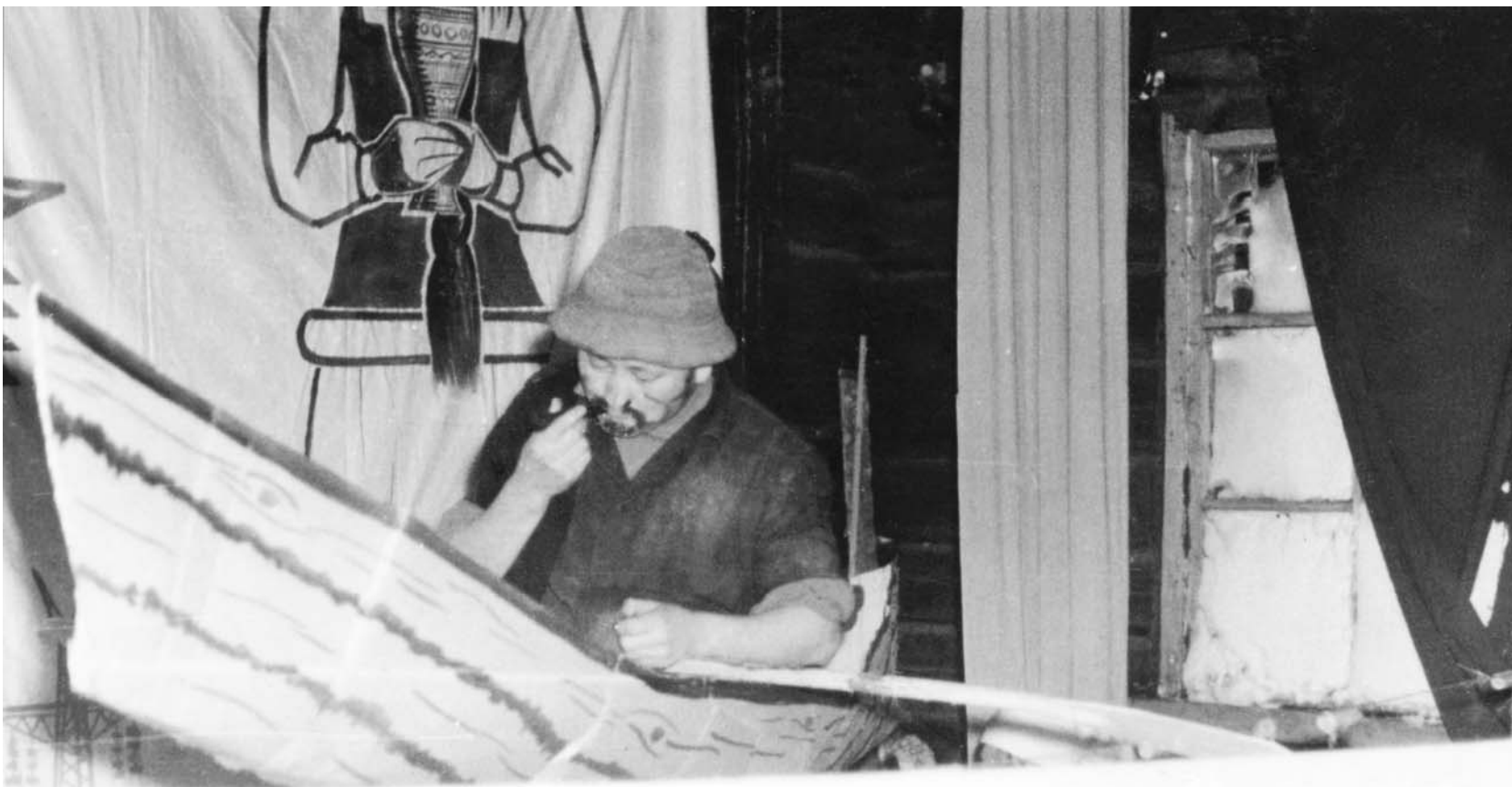
Тыя кулубун артыына