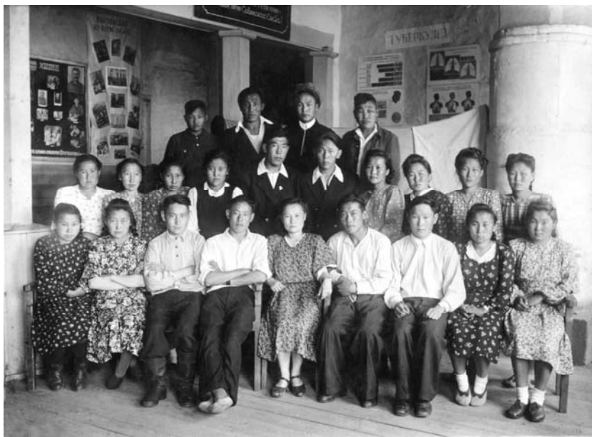
1953 с.Ытык- Күөл оскуолатын бүтэрбиттэр