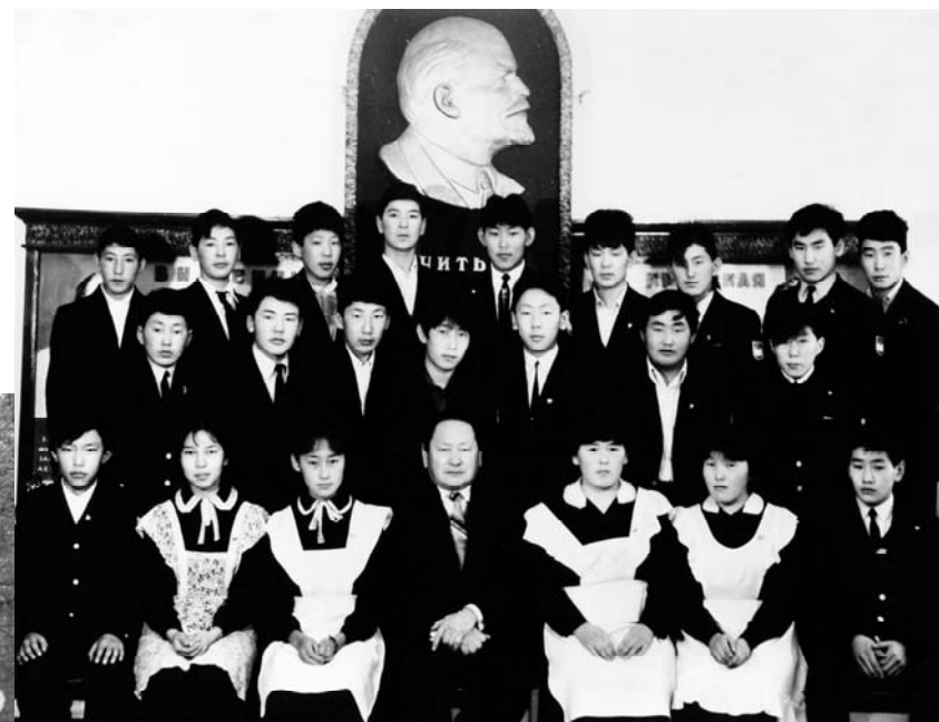
Кылааһын оболоро 1987 с.