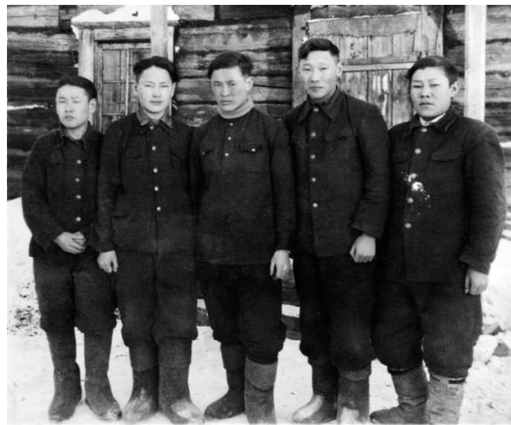
Оскуола кэнниттэн үөрэнэ бараары...