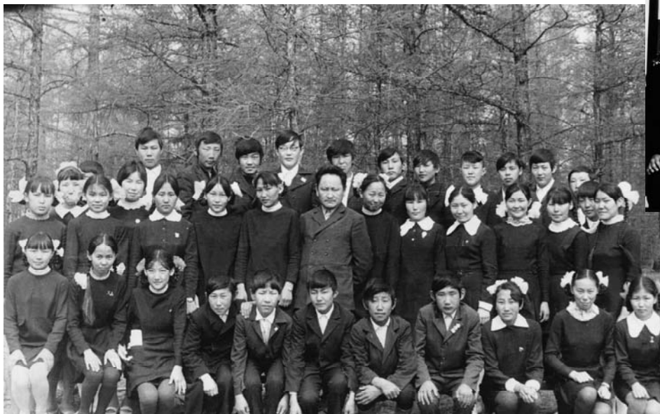
Кылааһын оболоро 1974