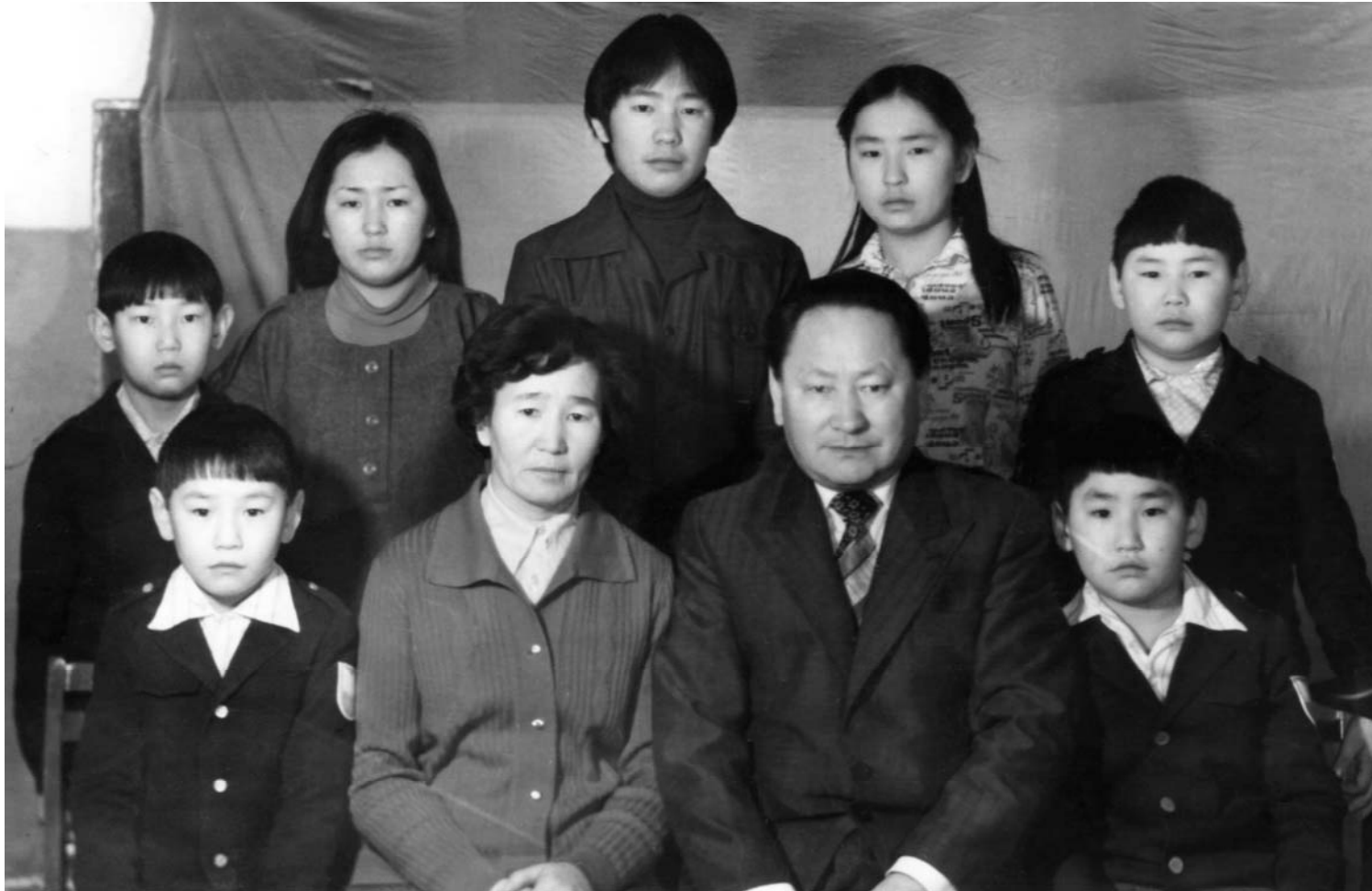
Анросовтар дьизэ кэргэн