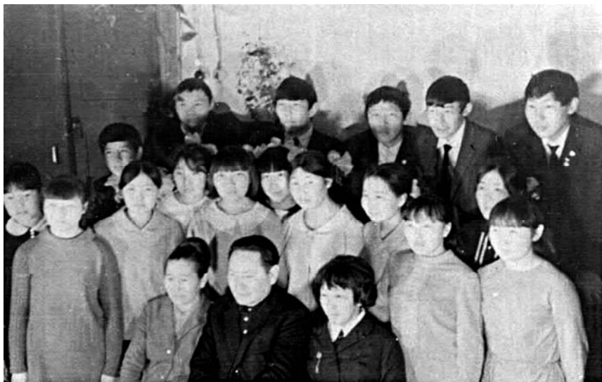
1969 сыллаахха кылаас салайааччыта